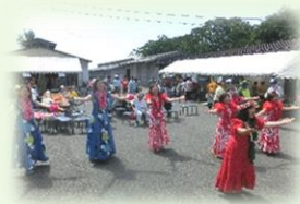
地域の皆さん参加の秋まつり