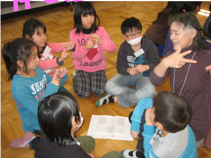
湖東第三小学校（手話体験）