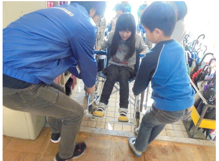
湖東第二小学校（車いす体験）

湖東地区の各小学校では、様々な体験を通して福祉や障がいに対する関心や理解を深めています。