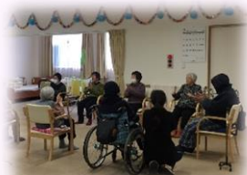
体操をする利用者