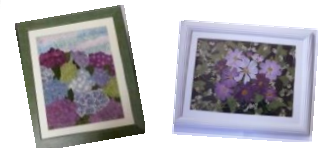
押し花アート教室

平成27年度“さざんか学習講座”には、たくさんの方が受講いただきありがとうございました。平成28年度も楽しい教室を企画しています。皆さんの受講をお待ちしています。