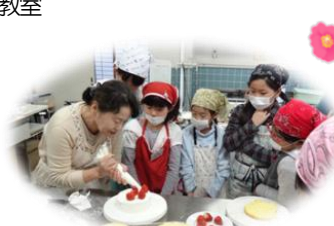
こどもクッキング教室