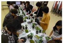
ミラクルレディー教室