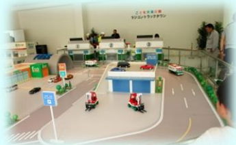
ジオラマの町を運転操作します