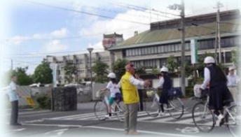
あいさつ運動を行うボランティアの方

皆さんも、登下校の生徒、子どもたちに出会ったら、“地域の人は、子どもたちを見守っているんだ”という想いで、“おはよう、おかえり”の「あいさつ」をお願いします。(小川)