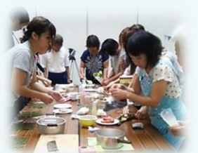
「おにぎらず」を作る参加者