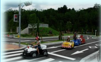
EVカーで運転する子どもたち