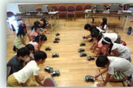
ロボットを動かそう