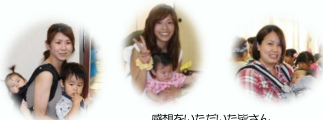
感想をいただいた皆さん