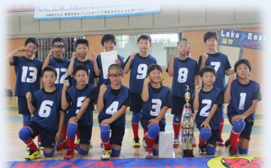
レイクイーストファイヤーズSPの皆さん

「人優我厳【じんゆうわげん】：人には優しく、自分には厳しく」をモットーに、ドッジボールを通して子どもたちの健全育成ができればと思っていますので、今後もチームの活動にご支援を賜りますようよろしくお願いいたします。（藤井 先生）